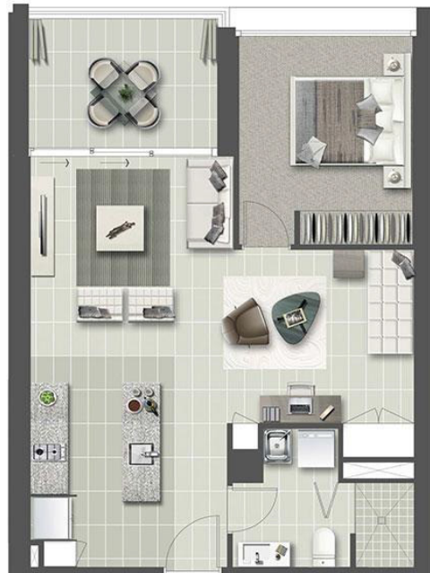
UNIT TYPE D 1:50